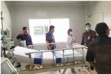
Gedung PALMA yang menjadi tempat perawatan pasien Covid gawat akan segera diungsikan.

"Kami memenuhi semua standar yang ditetapkan oleh Kemenkes. Untuk itu, kami sedikit kewalahan, karena adanya lonjakan pasien Covid-19. Tenaga kesehatan yang tersedia juga harus lebih ekstra kerja keras, karena harus memberikan pelayanan yang prima," pungkasnya. (mp/jp)