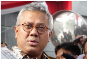
Ketua KPU RI, Arief Budiman

Sedangkan lima kabupaten dengan partisipasi pemilih tertinggi adalah Pegunungan Arfak, Papua Barat (99,25 persen), Bolaang Mongondow Timur, Sulawesi Utara (94,94 persen), Bolaang Mongondow Selatan, Sulawesi Utara (94,54