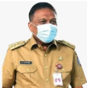
OLLY DONDOKAMBEY, SE. GUBERNUR SULAWESI UTARA

EXPOSEMEDIA, MANADO — Warga Kota Manado dan sekitarnya yang ingin belanja atau sekadar nongkrong di mall atau pusat perbelanjaan, siap-siap jalani rapid test. Tak hanya itu. Bagi mereka yg kedatangan reaktif akan diminta untuk menjalani test usap atau swab test.