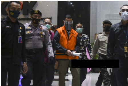
Menteri Sosial Juliari P. Singalinga berjalan menuju mobil tahanan usai menjalani pemeriksaan di Gedung Komisi Pemberantasan Korupsi (KPK), Jakarta, Minggu (6/12/2020). KPK menahan Menteri Juliari P. Singalinga yang telah ditetapkan sebagai tersangka atas dugaan menerima suap terkait pengalangan bantuan sosial penanganan COVID-19 di Kementerian Sosial usai Operasi Tangkap Tangan (OTT) pejabat Kemensos.