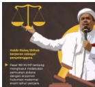
Habib Rizieq Shihab berjanji sebagai penunggang.

Hasil dalam lidik, sidik, konstruksi pasal ditambahkan Pasal 216 KUHP, Pasal 14 dan 15 UU Nomor 1 Tahun 1946 tentang Peraturan Hukum Pidana. (RED/rep)